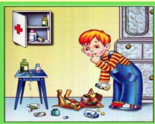
Не трогай таблетки