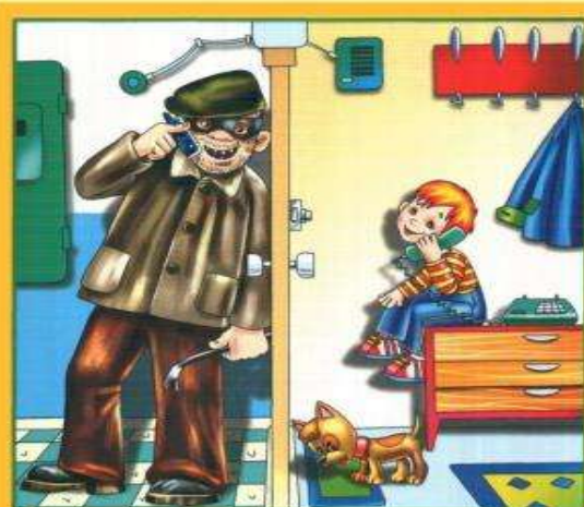
Не разговаривай и не открывай дверь незнакомым людям