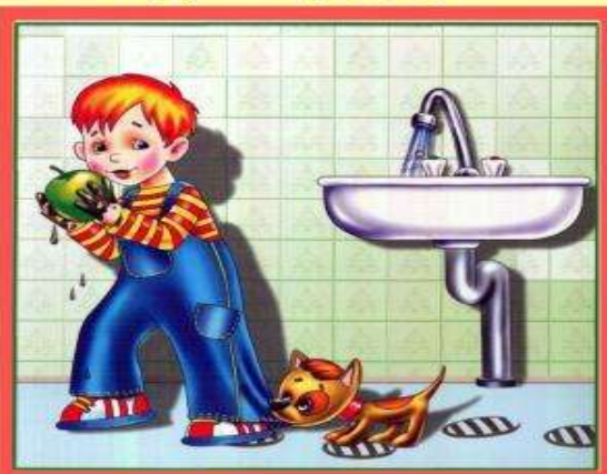
Мойте руки перед едой